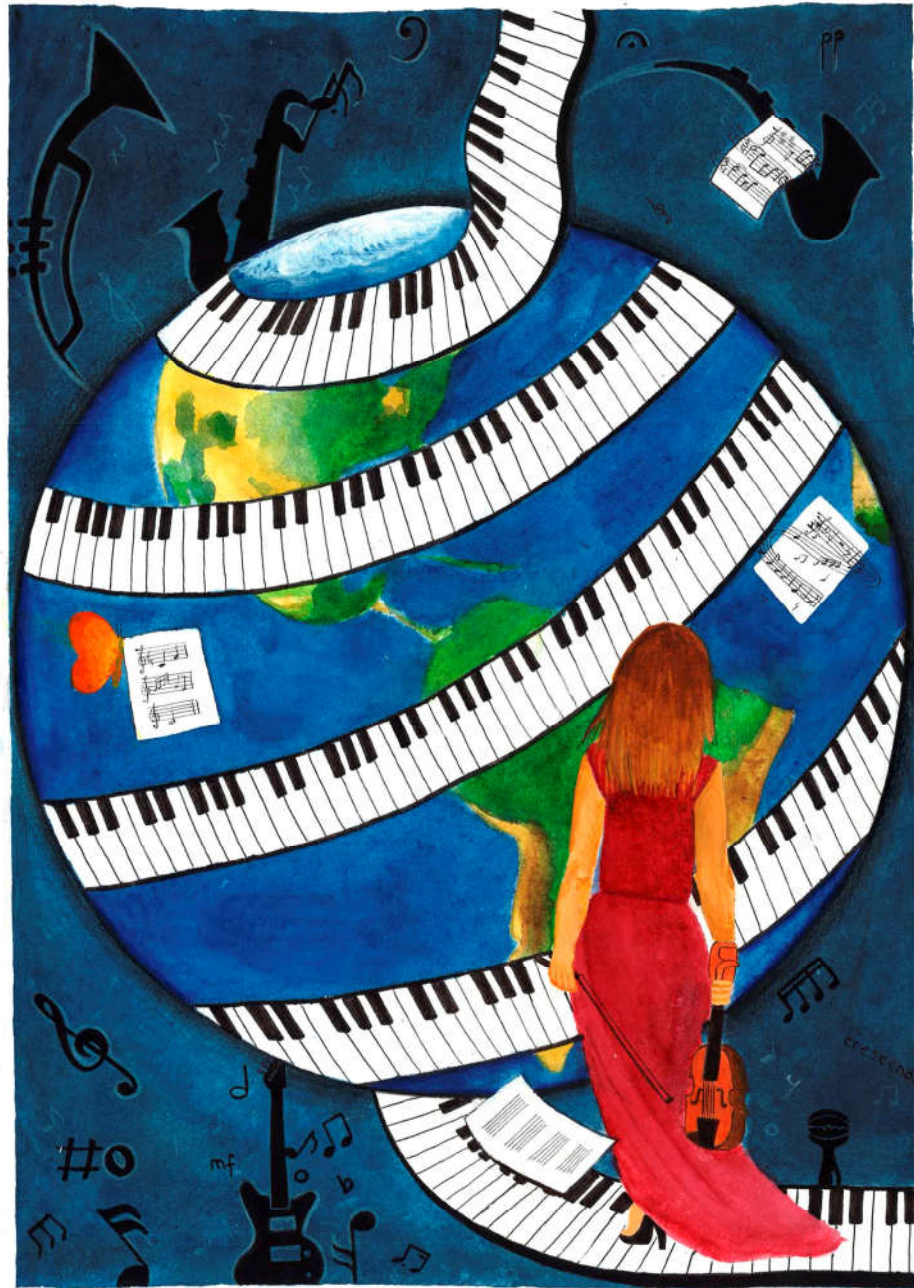
Autora: Carmen Gil Gil