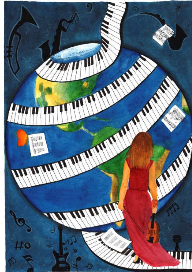
Autora: Carmen Gil Gil